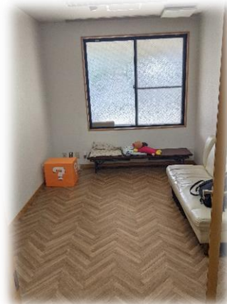
【カームダウン室・静養室】